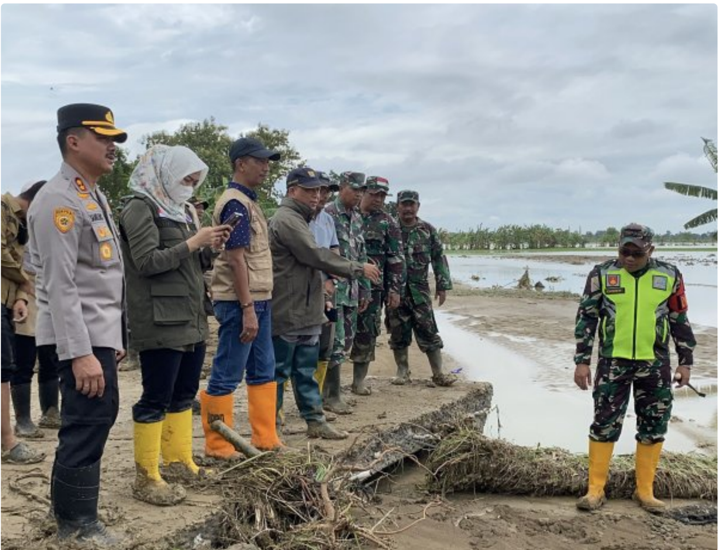
Dandim 0716/Demak Bersama Forkopimda Meninjau Tanggul Sungai Tuntang Demak Yang Jebol

Demak - Tanggul Sungai Tuntang Demak yang jebol di Dukuh Wareng, Desa Kebonagung, Kecamatan Kebonagung mulai ditangani secara darurat dengan melibatkan TNI, Polri, BPBD, hingga masyarakat. Penanganan tanggul Sungai Tuntang Demak ini difokuskan pada penutupan titik jebol serta pemulihan akses