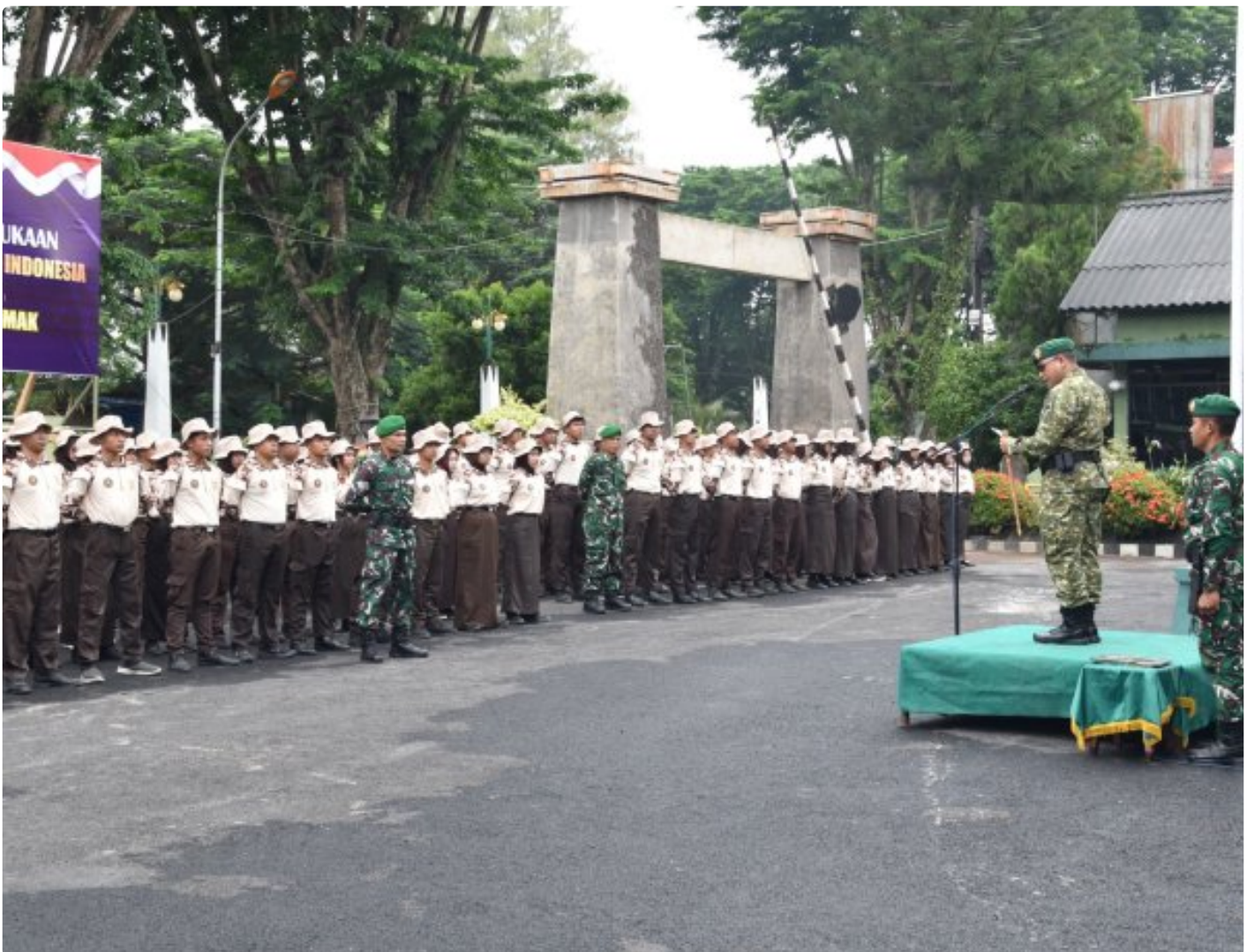
Dandim Demak Resmi Buka Gelaran Korps Kadet Republik Indonesia (KKRI) Di Wilayah Demak

DEMAK – Kodim 0716/Demak secara resmi membuka kegiatan Korps Kadet Republik Indonesia (KKRI) Gelombang IV Tahun 2026 melalui upacara yang khidmat digelar di Lapangan upacara Makodim 0716/Demak Jl. Kiyai singkil No.1 Demak. Jumat (13/2/2026)